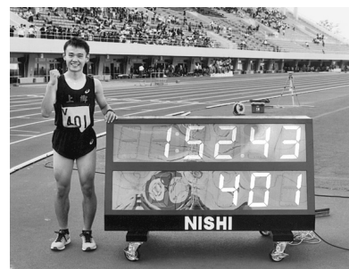
日本中学新記録を樹立