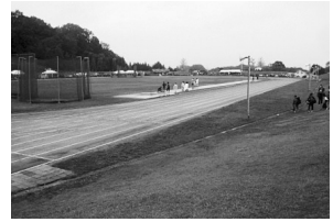
岡崎県営グラウンド

1968年に開場し、長年「ケンエイ」の愛称で、多くの県民、特に岡崎市をはじめとする西三河地区のスポーツ愛好者に親しまれてきた「愛知県岡崎総合運動場」が、愛知県から岡崎市へ移管されるという発表があった。これを機に、岡崎市では現在の競技場を、全天候型トラックを有する3種陸上競技場に整備するという計画も後日紙上にて発表された。現在の競技場は来年度から使用ができなくなり、新競技場は2020年開場予定とのことである。岡崎市は陸上競技の盛んな都市であり、選手や関係者にとって新競技場建設は長年の夢であった。そして今、念願が叶うこととなり、移管にご尽力くださった皆様方のお力添えに謝意を示しておきたい。