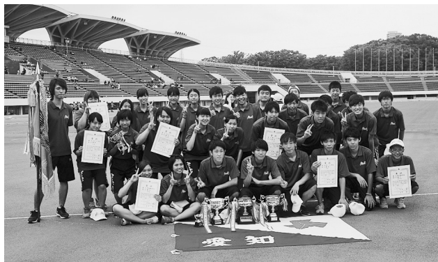
来年も駒沢で歓喜の時を迎えよう！

科技高刈谷を中心とした3年生や4年生が大きな力を発揮したことで、この2年は総合優勝を成し遂げましたが、来年の全国大会は接戦となりそうです。これからもこの喜びや達成感を感じたいなら、現状に満足することなく努力するしかありません。学校として、選手一人一人として限られた環境での練習かもしれませんが、可能な限り継続して練習することと「やる時はしっかりやる」という気持ちで取り組まないと同じ思いはできないと思います。来年は本当の愛知の強さが問われる大会になりそうです。素晴らしい経験を生かし、来年に向けて今からスタートしましょう！