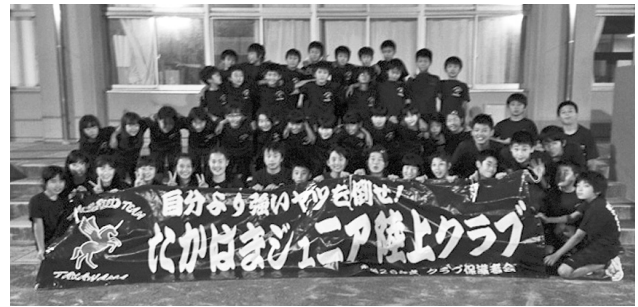
水曜日の練習小学生全員集合

練習は水、土の週2回、地元の小学校等で行なっておりますが、志ある選手はウェーブスタジアム刈谷で月、金もライバルを探しながら練習を行なっています。「チャンスは無限。チャンスボールにはチャンスとは書いていない。これだと思ふボールは逃げずにしっかりと受け止め、自分の可能性を信じ、限界にチャレンジ。道は必ず開け、違った世界(限界の向こう側)を見ることができる」の考えの