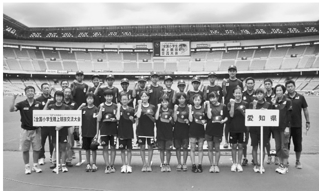
【日産スタジアムでの記念撮影】

その成果として、女子走幅跳と女子リレーが1位、男子走幅跳と女子80mHが2位、男子リレーが3位、男子走高跳が5位に入賞しました。中でも圧巻だったのが女子のリレーです。予選を50秒99の大会新記録で走り、準決勝と決勝では会場中の注目を集め、堂々の1位を獲得しました。岡崎JACとしても昨年に続き大会連覇を達成しただけでなく、リオデジャネイロオリンピックで日本の男子4×100mRが歴史的な銀メダルを獲得したまさにその日の優勝でした。会場内でもリオ五輪のリレーの映像が流されましたが、岡崎JACのリレーチームは、五輪以上の感動