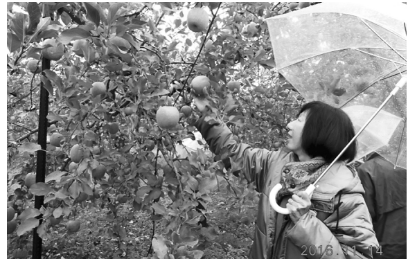
下伊那のリンゴ園にて

年明けには西三河地区担当の宿泊懇親会を計画しています。多くのご参加を期待いたします。