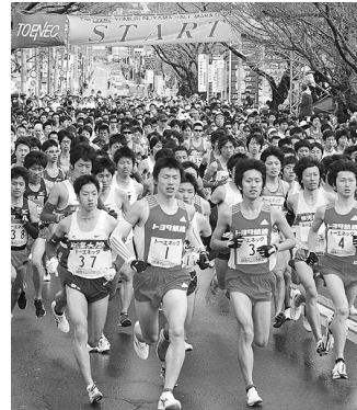
スタートする選手たち

2月28日(日)、名証犬山総合運動場を発着点とする日本陸連公認コース(21.0975kmと10km)で開催された。新設された登録10km(男子・女子・高校男子・高校女子)を加えた8種目(469名完走)で行われた。犬山市・読売新聞社をはじめ、レース運営にご支援いただいた関係各位に厚くお礼申し上げます。