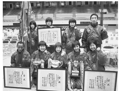
喜びの豊川高チーム