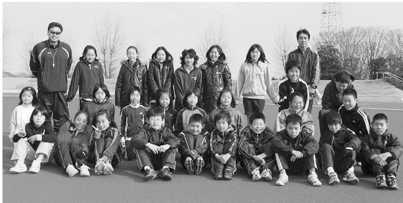
今年がんばるぞ!!と意気込むクラブ員

江南市広報やタウン誌の募集欄に掲載していただきました。それとチラシを作成し、ポスティングも行い周知に努めました。