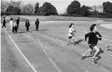
練習風景 (スタートダッシュ)

AC一宮のACとは、アスリート・クラブの略称で、小・中学生や、陸上競技を志す方なら誰でも会員になることができます。平成20年1月1日をもって、これまでのJAC一宮からAC一宮という名称に変更いたしました。AC一宮の前身のJAC一宮は、小中学生が陸上競技を通して、健全な心身を育てていくことを目指し、平成5年5月5日に発足いたしました。以降、多くのアスリートを送りだしてきましたが、当クラブの出身者が成人し、指導者やリーダーとして戻ってくるようになり、陸上競技会の審判活動などでも活躍できるようになってきました。そこで本年より、陸上競技を目指す一般会員の登録も行い、地域に根ざしたクラブ活動を行なっていきたいと願い、名称の一部のジュニアのJを取り去り、新しい活動を進めることになりました。