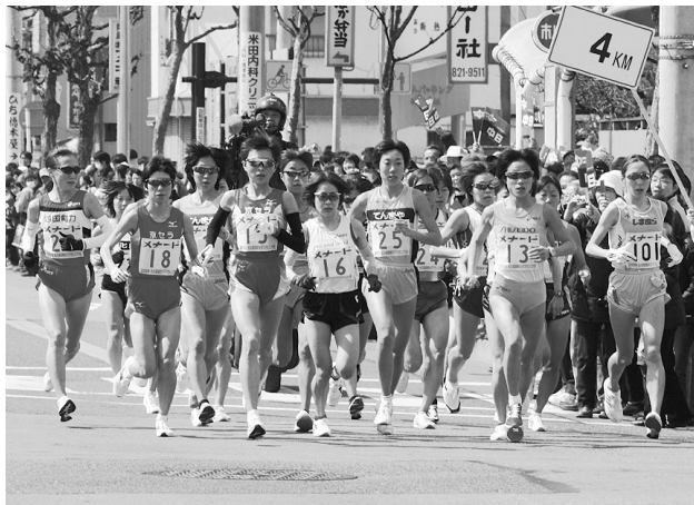
名古屋国際女子マラソン