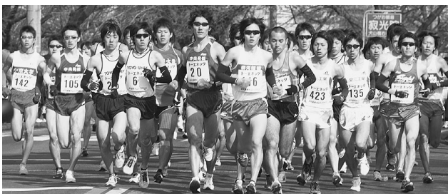
栄光のゴール目指して力走する選手たち

主催の読売新聞社、犬山市をはじめ、愛知県警、陸上自衛隊春日井駐屯地、ボランティアの皆様、ご協賛の企業各社に深く感謝申し上げます。