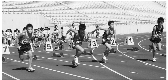
ヨーイ・ドン! 素晴らしいスタートをする小学生たち (11/3 瑞穂陸上競技場にて)

20種目に熱戦を展開し、大会記録を4種目更新した。優勝を13団体で分け合った。 7月 “日清食品カップ” 全国小学生陸上競技交流大会 14種目に出場し、優勝1種目を含む8種目に入賞した。愛知県友の会記録を1種目更新した。 9月 東海小学生リレー競走大会 男女混合・男子・女子の4×100mRに3チームずつ9チームが出場し、9チーム全部が決勝に進出した。2チームが優勝し、愛知県友の会記録を1種目更新した。 11月 愛知県小学生陸上競技選手権大会 32種目に熱戦を展開し、愛知県友の会記録を4種目・大会記録を5種目更新した。優勝を20団体で分け合った。